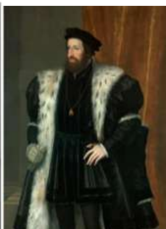
Фердинанд Габсбург . Император Священной Римской империи

👉 Задание 2. Какие известные экспонаты изображены на иллюстрациях? В каких музеях они хранятся?