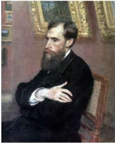
Третьяков Пётр Михайлович. Художник И.Е. Репин