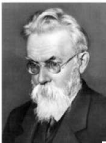
В. И. Вернадский